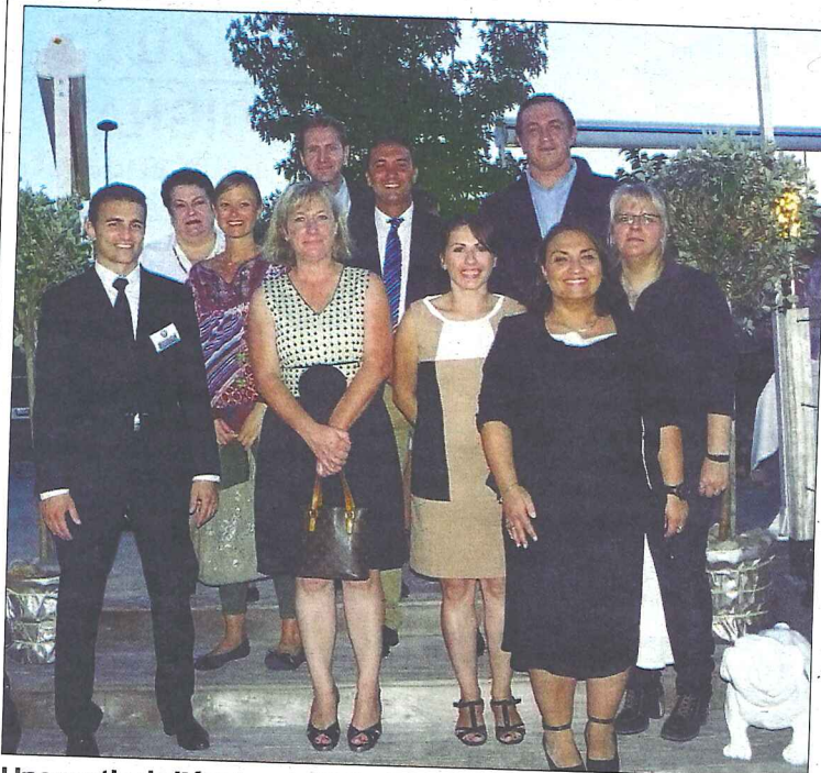
Une partie de l'équipe de l'hôtel.