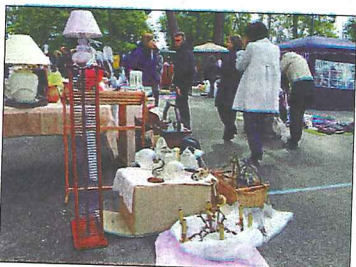
Vide-greniers à Arlac.

Ce week-end des 5 et 6 octobre, Arlac accueillera de nombreuses animations. Le comité des fêtes du quartier organise une fête foraine sur les deux jours. Un feu d'artifice sera tiré samedi 5 octobre, à 22 h 30. Le dimanche sera marqué par un grand vide-greniers, de 8 à 18 heures.